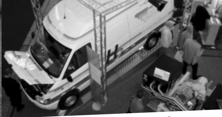
Brennstoffzellenbetriebener Lieferwagen „Sprinter“ der DaimlerChrysler AG

Die heutige Nutzung von Benzin und Diesel stellt einen Raubbau an der endlichen Ressource Erdöl dar und vollzieht sich nicht in Kreisläufen. Pflanzenöl dagegen kann und wird wieder regional und global geschlossene, naturgemäße Kreisläufe ermöglichen. Dies gilt insbesondere für die CO 2 -Frage.