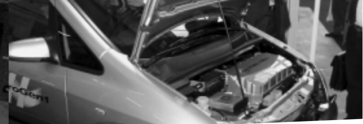
Brennstoffzelle im Motorraum des Opel Zafira HydroGen

Letztlich enthalten alle Samen und das Fruchtfleisch mancher Gehölze (z. B. Avocado, Ölpalme) Pflanzenöle bzw. Pflanzenfette. So zahlreich die Züchtungen in Hinblick auf Ertragssteigerungen oder Veränderungen der Fettsäuremuster und in Bezug auf Speiseöl-Qualität oder industrielle Anwendungen bei nur wenigen Ölpflanzen erfolgten, so gut wie keine züchterische Arbeit hat bisher stattgefunden, was die Nutzung der verschiedensten Pflanzenöle als Treibstoffe anbelangt. Das