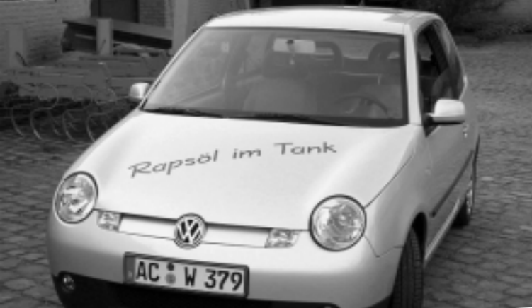
VW Lupo mit Pflanzenölmotor

Erinnern Sie sich noch an den Herbst 2000? An die Tankstellenblockaden in England und die wütenden Proteste in ganz Europa? Wenn es um Energie geht, verstehen die Menschen offenbar keinen Spaß! Die wesentliche Ursache der Preissteigerungen: Die Industriestaaten (USA und EU) sind nicht mehr in der Lage, durch Eigenförderung den Erdöl-Weltpreis niedrig zu halten, die Verknappung an Erdöl hat eingesetzt und die OPEC-Länder bestimmen den Preis!